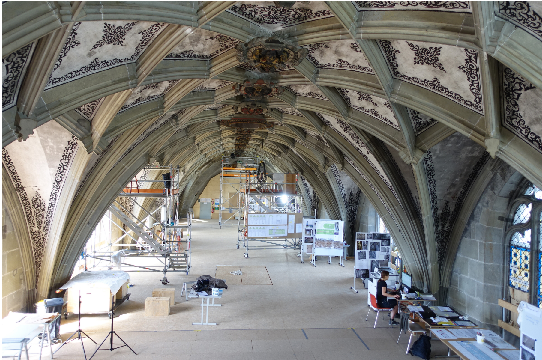
01: Blick in die Baustelle unter dem Mittelschiffgewölbe