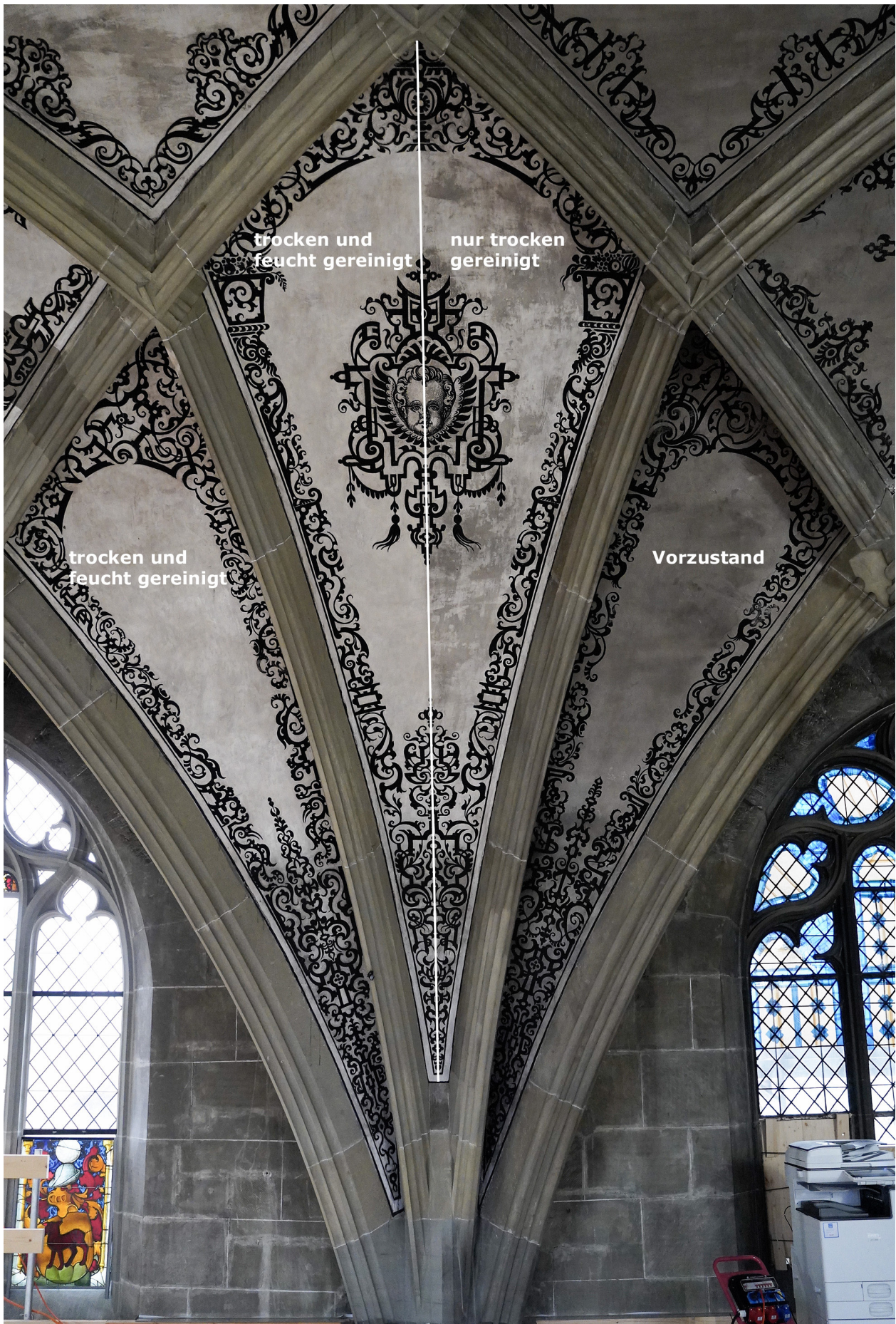
02: Referenzkappen (050-060.230) in unterschiedlichen Reinigungsstufen. Links trocken und feucht gereinigt; Mitte: linke Hälfte trocken und feucht gereinigt, rechte Hälfte nur trocken gereinigt; rechts: nicht gereinigt.