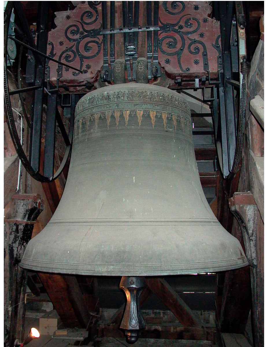
08 + 09: Bild Armsünder-Glocke + Joch Grosse Glocke