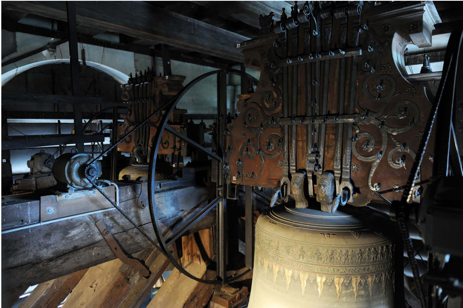
07: Joch Grosse Glocke mit Motoren