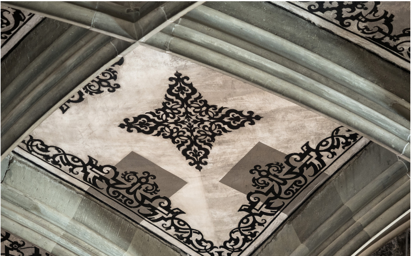
03 + 04: Musterkappen mit Vergleichsflächen: Vorzustand gegenüber trocken gereinigt und Vorzustand gegenüber trocken und feucht gereinigt.