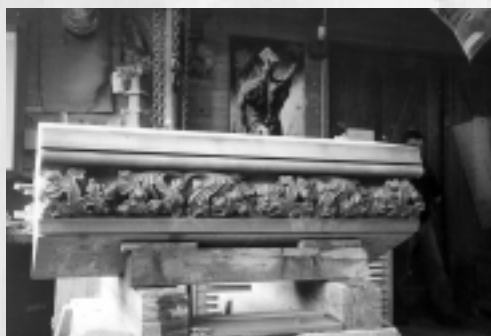
Rechte Seite: Entste- hung Laubwerk