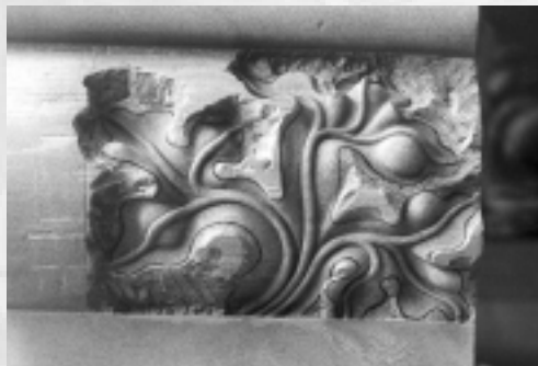
Links: Versetzen der Brüstung