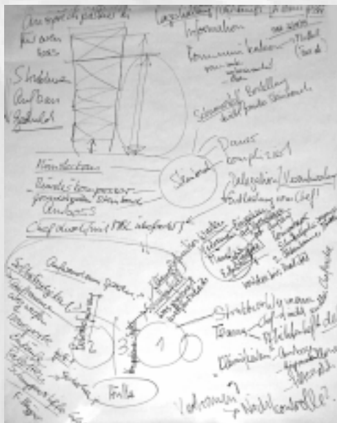
Brainstorming erstes Hüttengespräch