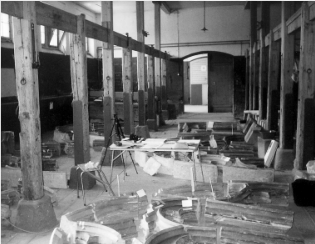
Masswerke vor Abtransport und Einlagerung im Depot Aegerten