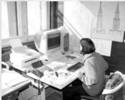
Arbeitsplatz Hilfs- sekretariat Münsterbauhütte

Koordination und Informationen in und ums Münster.