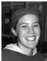
Fürst Yvonne Steinhauerin 3. LJ