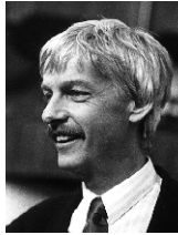
Präsident MBK: Dr. Schweizer Jürg Denkmalpfleger des Kantons Bern