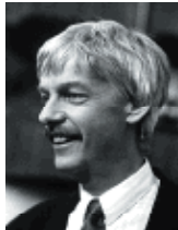
Präsident MBK: Dr. Schweizer Jürg Denkmalpfleger des Kantons Bern